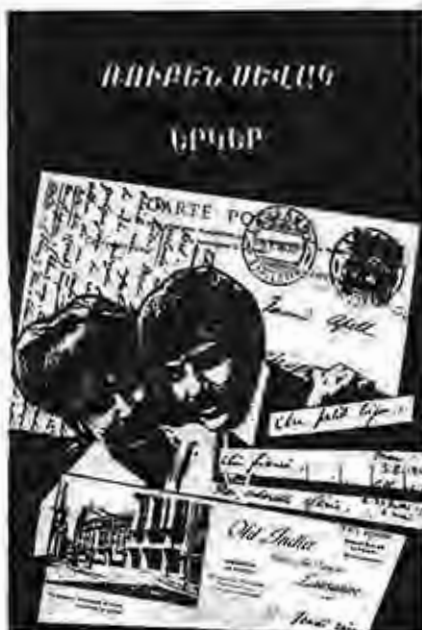
Rupen Sevag, Yegor.

vag'ın öldürülmesinden sonra üstünde bulunan kişisel eşyalarının ailesine verilmesi için yazışmalar yapıldı. 437 Daha sonra bu eşyalar arasında bulunan iki yüzük vesairenin eşine verilmesi için talimat verildi. 438