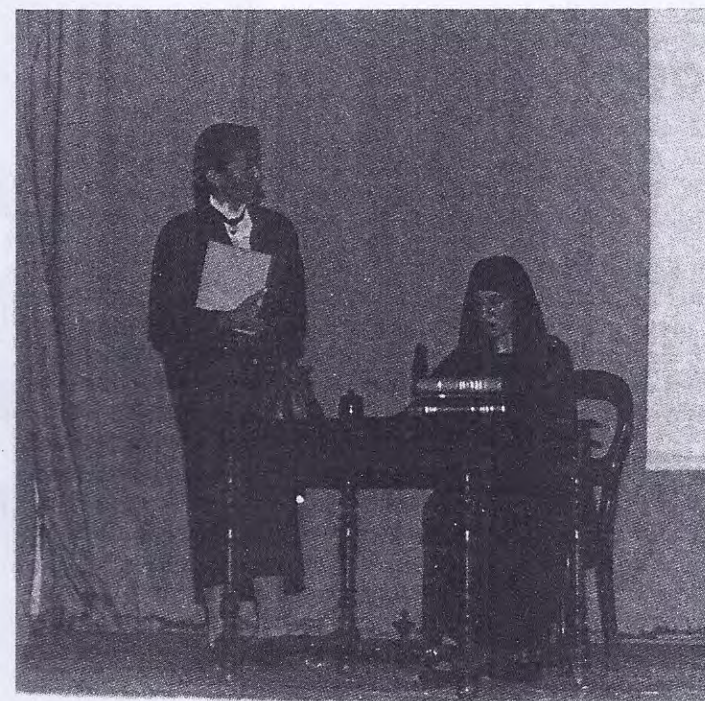
4 ème Tableau