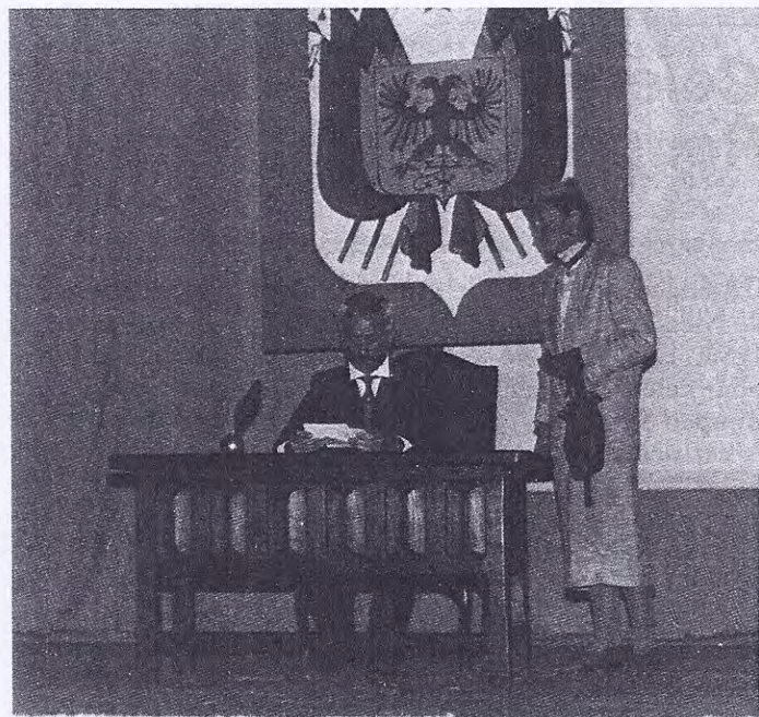
5 ème Tableau

Quant à Vangenheim, il se cache derrière le paravent de la non-ingérence dans les affaires intérieures de la Turquie et justifie l'extermination du peuple arménien par l'état de guerre dans lequel se trouve le pays. A l'accusation de Vangenheim la qualifiant de traître à sa patrie, Jannie répond : "C'est vous qui êtes les vrais traîtres... car en faisant exterminer un peuple... vous avez trahi l'humanité". C'est sur cette phrase lourde de sens que se termine la pièce.