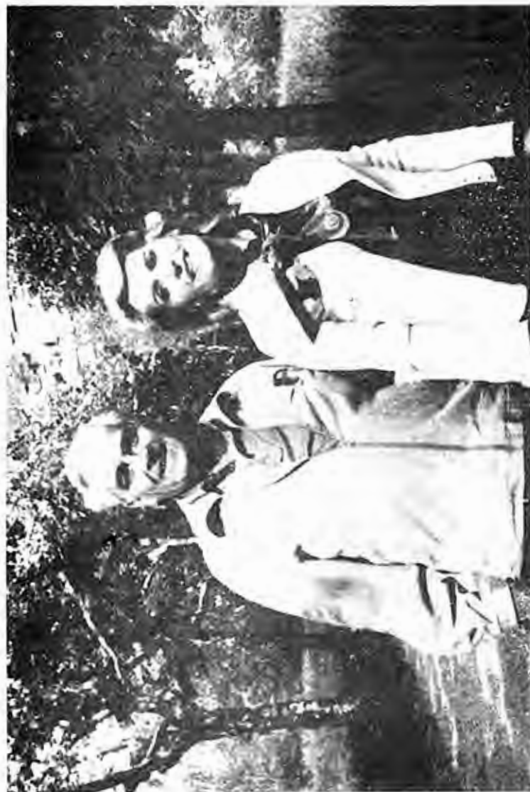
Знакомство с Уолкер 1950. Р. С. Веттер