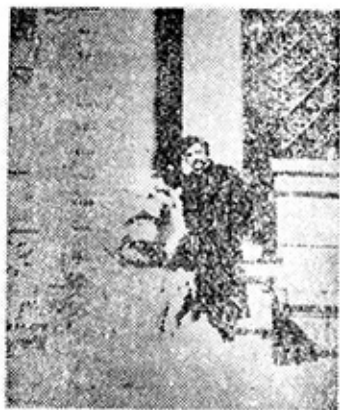
Ռ. ՍԵՎԱԿ, ԼՈՉԱՆ, 1911 թ.