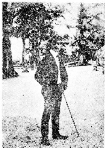
Ռ. ՍԵՎԱԿ, ԼՈՉԱՆ, 1910 թ.