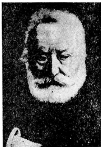
Ռ. ՍՆՎԱՆ, ՎԻՆՏՐ ՀՅՈՒԳՈՅԻ ԳԻՄԱՆԱՐԸ