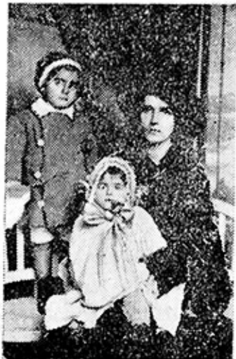
ՏԻԿԻՆ ՅԱՆՆԻ ՍԵՎԱԿԸՐ ՋԱՎԱԿՆԵՐԻ ՇԱՄԻՐԱՄԸ ԵՎ ԼԵՎՈՆԻ ՇԵՏ