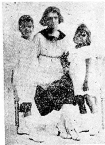
ՏՐԻՆ ՅԱՆՆԻ ՍԵՂԱԿԸ՝ ՉԱՎԱՆՆԵՐԻ ՀԵՏ