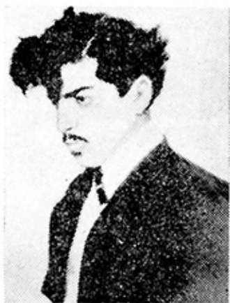
Ռ. ՍՆՎԱՆ, ՆՐՈՆՏԻՍՊԻՍ